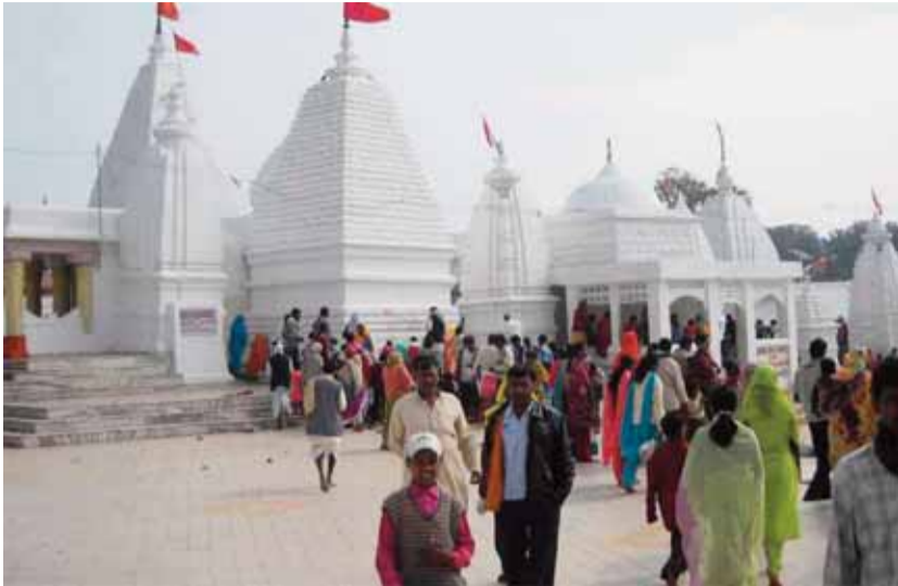
हरिभूमि न्यूज अनूपपुर।

परंपरा, आस्था और ज्योतिष का रहस्य मकर संक्रांति का पर्व भारतीय संस्कृति खगोल विज्ञान और अध्यात्म का अद्भुत संगम है। यह पर्व सूर्य के मकर राशि में प्रवेश का प्रतीक है जिसे सूर्य का उत्तरायण होना कहा जाता है। इसी दिन सूर्य दक्षिणायन से उत्तरायण की ओर गमन प्रारंभ करते हैं जिससे दिन बड़े और रातें छोटी होने लगती है। यह सर्द ऋतु के अंत और नई फसल के आगमन का उल्लासपूर्ण उत्सव है, जो प्रकृति एवं मां पृथ्वी के प्रति कृतज्ञता व्यक्त करता है। मकर संक्रांति के पावन अवसर पर श्रद्धालुजन पवित्र नदियों विशेषकर मां नर्मदा एवं मां गंगा में स्नान कर पुण्य लाभ प्राप्त करते हैं। शास्त्रों के अनुसार इस दिन किया गया स्नान, दान एवं जप पापों से मुक्ति और आध्यात्मिक उन्नति प्रदान करता है। तिल एवं गुड़ से बने लड्डुओं का सेवन और दान करने की परंपरा है जो शरीर को ऊर्जा और ऊष्मा प्रदान करती है।