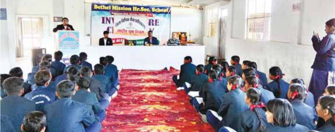
अनूपपुर।