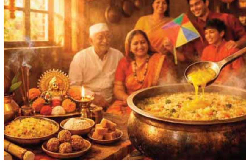
हरिभूमि न्यूज अनूपपुर।

नमः" मंत्र का जाप करना अत्यंत फलदायी माना गया है। शनिदेव की कृपा प्राप्ति हेतु इस दिन उड़द दाल की खिचड़ी बनाना एवं दान करना भी शुभ माना जाता है। इस दिन खरमास समाप्त हो जाता है और विवाह, गृह प्रवेश सहित सभी मांगलिक कार्यों का शुभारंभ हो जाता है। वर्ष 2026 में मकर संक्रांति का पर्व 14 जनवरी को मनाया जाएगा। इस दिन पुण्य काल दोपहर 3:13 बजे से 4:58 बजे तक रहेगा। शास्त्रों के अनुसार इस काल में किया गया स्नान, दान एवं पूजा अक्षय पुण्य प्रदान करता है तथा जीवन में सुख-समृद्धि का वास होता है। इस वर्ष मकर संक्रांति पर एकादशी का विशेष संयोग भी बन रहा है, जो पर्व के महत्व को और बढ़ाता है। पूरे देश में इस त्योहार को अलग-अलग नामों से मनाया जाता है। इस त्योहार को खिचड़ी के नाम से भी जाना जाता है। उत्तर भारत के कई राज्यों में इस दिन खिचड़ी बनाई और खाई जाती है साथ ही इसका दान भी किया जाता है ये एक पुरानी परंपरा है यही कारण है कि मकर संक्रांति का नाम आते ही खिचड़ी याद आ जाती है लेकिन इस परंपरा के पीछे सिर्फ स्वाद भर नहीं है बल्कि गहरी आस्था